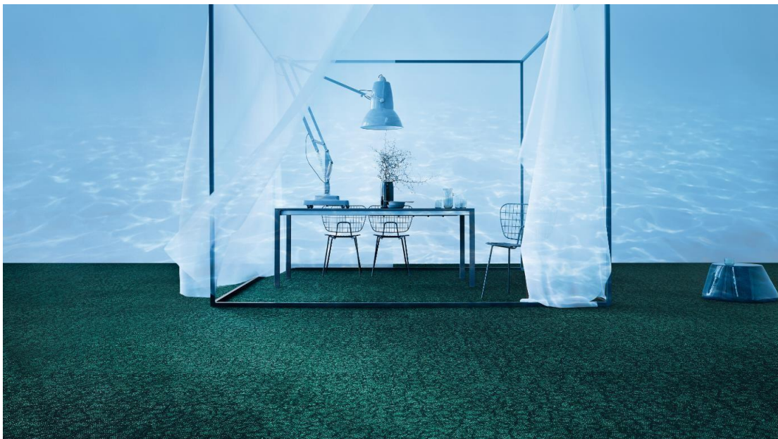
VELAA heißt Schildkröte auf Dhivehi – der Amtssprache der Malediven. Diese extrem bedrohte Art war Namensgeber für das Dessin, das exklusiv für HEALTHY SEAS entwickelt wurde. Mit jedem Quadratmeter VELAA unterstützt OBJECT CARPET diese nachhaltige Initiative zum Schutz der Meere.