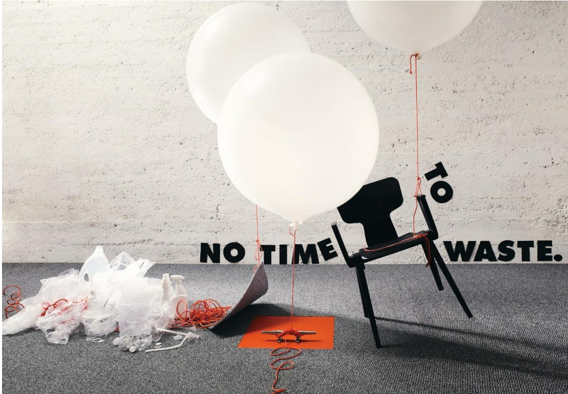
NEOO, der erste komplett zirkuläre Teppichboden aus Mono-Material.