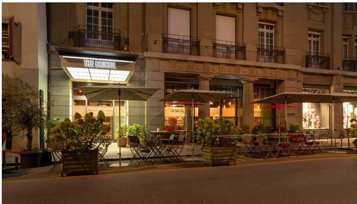
Hotel The Bristol Bern