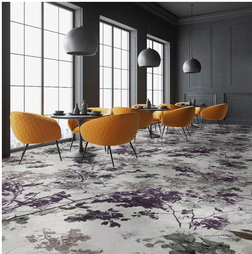
MILEY Foto: OBJECT CARPET