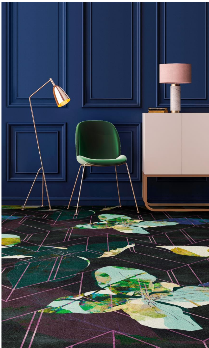
RUBINA Foto: OBJECT CARPET