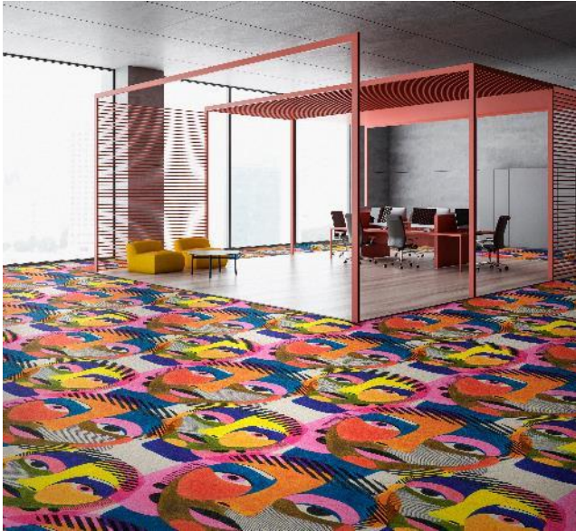
FORUM „SHARI“