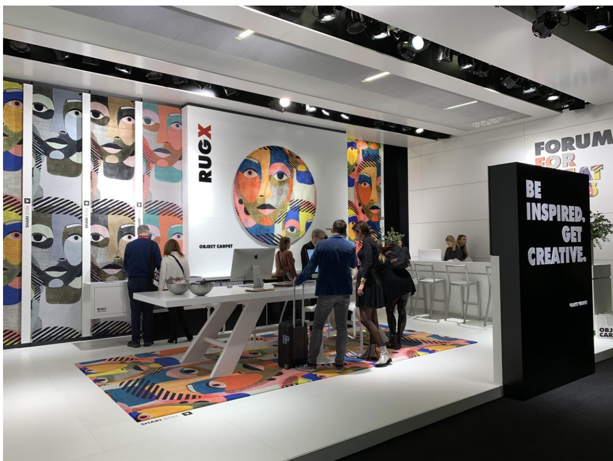
Messestand von OBJECT CARPET auf der imm cologne 2020

Neben der stilistischen Vielfalt und den quasi unbegrenzten Planungsmöglichkeiten überzeugen die FORUM -Teppichkreationen auch mit ihren nachhaltigen und wohngesunden Eigenschaften sowie ihrer Strapazierfähigkeit und Objektauglichkeit. Alle FORUM -Qualitäten sind standardmäßig mit WELLTEX® Akustik Plus ausgerüstet. Die Teppich-Rückenkonstruktion WELLTEX® Akustik Plus besteht aus recyceltem PET-Material und ist frei von Bitumen, PVC, Latex, Gerüchen sowie schädlichen Emissionen. Sie verbessert sowohl die Akustik als auch das Raumklima. Die innovative Rückenkonstruktion von OBJECT CARPET ist rundum nachhaltig und wohngesund. WELLTEX® wurde bereits mehrfach prämiert und erhielt während der imm cologne eine weitere Auszeichnung: Der Verband Netzwerk Boden hat WELLTEX® zum „Boden des Jahres 2020“ gekürt. Die Preisübergabe fand am 14.01.2020 am Messestand von OBJECT CARPET in Köln statt. Mit dieser erneuten Ehrung für WELLTEX® , der großen FORUM -Premiere und dem erfolgreichen Messeauftritt startet OBJECT CARPET schwungvoll in die neue Einrichtungssaison.