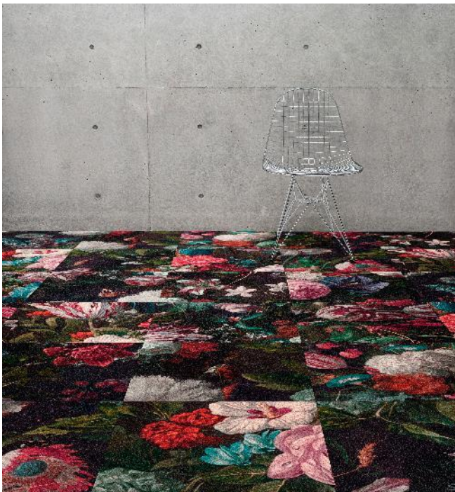
FORUM „SOFIA“